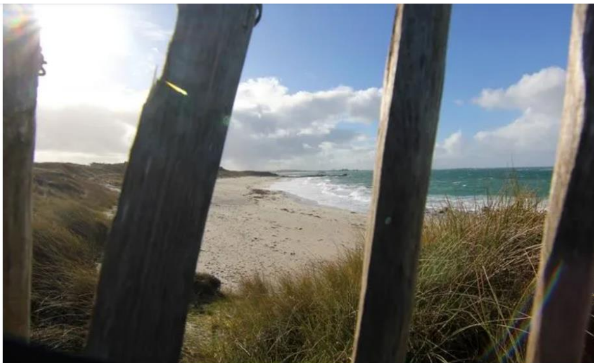
Les opposants à la ferme de porcs géante dénoncent la dégradation de la qualité des eaux de baignade à Landunvez.

En 2016, le préfet du Finistère avait bien validé l'extension du fils de l'ancien maire de Landunvez . Une décision surprenante au regard de l'avis défavorable rendu par le commissaire-enquêteur. Dans une enquête, le journal Splann! avait révélé qu'après cet avis défavorable, le commissaire n'avait pas été renouvelé dans ses fonctions l'année suivante. Saisie par plusieurs associations environnementales, la justice avait ensuite invalidé cette extension, estimant que l'étude d'impact n'était pas suffisante.