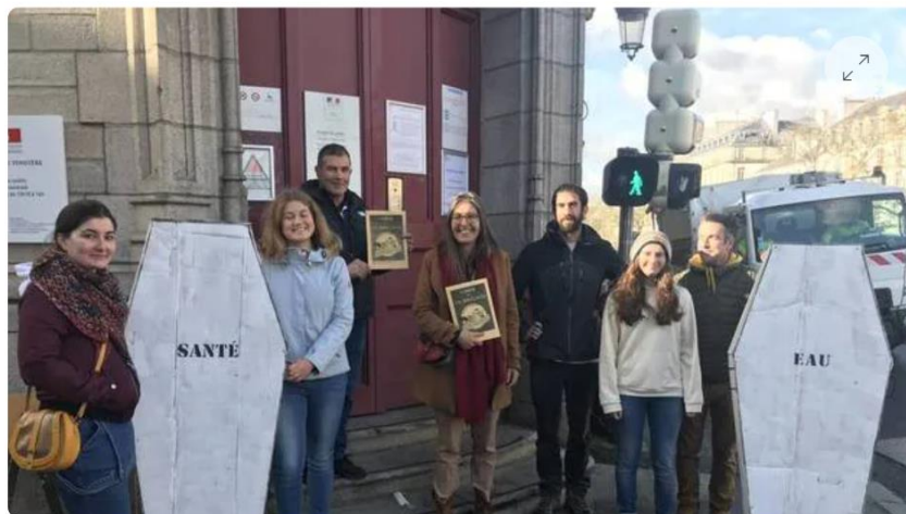
Des membres du collectif Stoppons l'extension étaient rassemblés à Quimper (Finistère) vendredi 4 novembre 2022, devant la préfecture.

Les cercueils de la « santé » et de « l'eau » encadrent la porte d'entrée de la préfecture, à Quimper (Finistère) , vendredi matin 4 novembre 2022. Ils ont été apportés par une dizaine de membres du collectif Stoppons l'extension , venu tout droit de Landunvez et Porspoder, près de Brest.